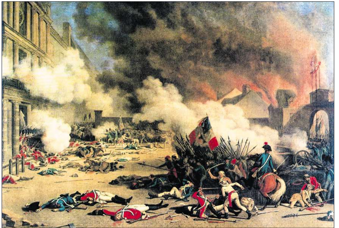
Paris 1792: truppas revoluziunaras assaglian il palaz roial che vegn defendi da schuldads svizzers e grischuns. (Jean Duplessis-Bertaux, 1793).

Tgi profitava dal servetsch mercenar? Per il simpel schuldà turnava il quint material pli u main, premess ch'el returnass insumma e n'avev betg da manar ina paupra vita d'invalid. El turnava strusch cun insatge a chasa e n'aveva – senza furmazion ni enconuschientschas da linguas ni bunas relaziuns – praticamain naginas pussaivladads da far carriera. Dal servetsch mercenar pudevan atgnamain profitar mo ils members da famiglias prominentas da l'aristocrazia. Els absollevan en pauc temp ina carriera d'uffizier, giudevan prestige social ed obtegnevan dapli sold. Els avevan la pussaivladad d'accumular ina facultad. Quels daners investivan els savens en lur patria: en chasas signurilas, palazis e parcs u era en interpresas